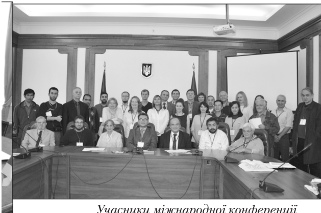
Учасники міжнародної конференції з аналітичної теорії чисел і просторових мозаїк в НПУ імені М. П. Драгоманова