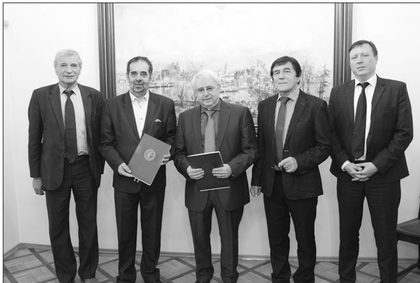
Підписання угоди про співробітництво з Опольським університетом (Польща)

Зокрема, тільки за останні роки підписано угоди про співробітництво з Білефельдським університетом у м. Білефельд (Німеччина), Державним університетом штату Нью Йорк в Онеонті (США), Казахським національним педагогічним університетом імені Абая (Казахстан), Ланьчжоуським Університетом (Китай), Гомельським державним університетом імені Франциска Скоріни (Білорусь), Університетом Малаги (Туреччина), Інститутом розвитку інтелекту (Південна Корея).