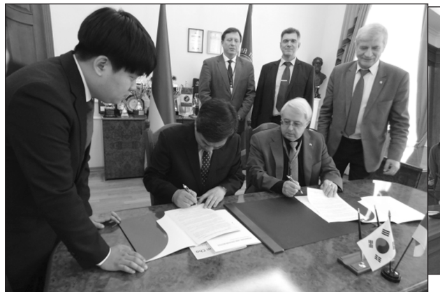
Підписання угоди з Інститутом розвитку інтелекту (Південна Корея)

Але на шляху до більшої мобільності студентів існує ще багато перешкод – від визнання на батьківщині отриманих знань і кваліфікації до фінансової підтримки, плати за навчання і професійних перспектив. Мовний бар'єр і економічні відмінності також упливають на мобільність. Зважаючи на ці причини, більшість студентів усе