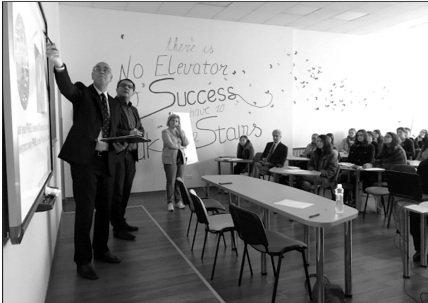
Щороку кожного місяця в університеті відбувається 2–3 міжнародні конференції або семінари

ще не в змозі скористатися можливістю навчання за кордоном, в університеті поширюється практика запрошення провідних закордонних фахівців до України.