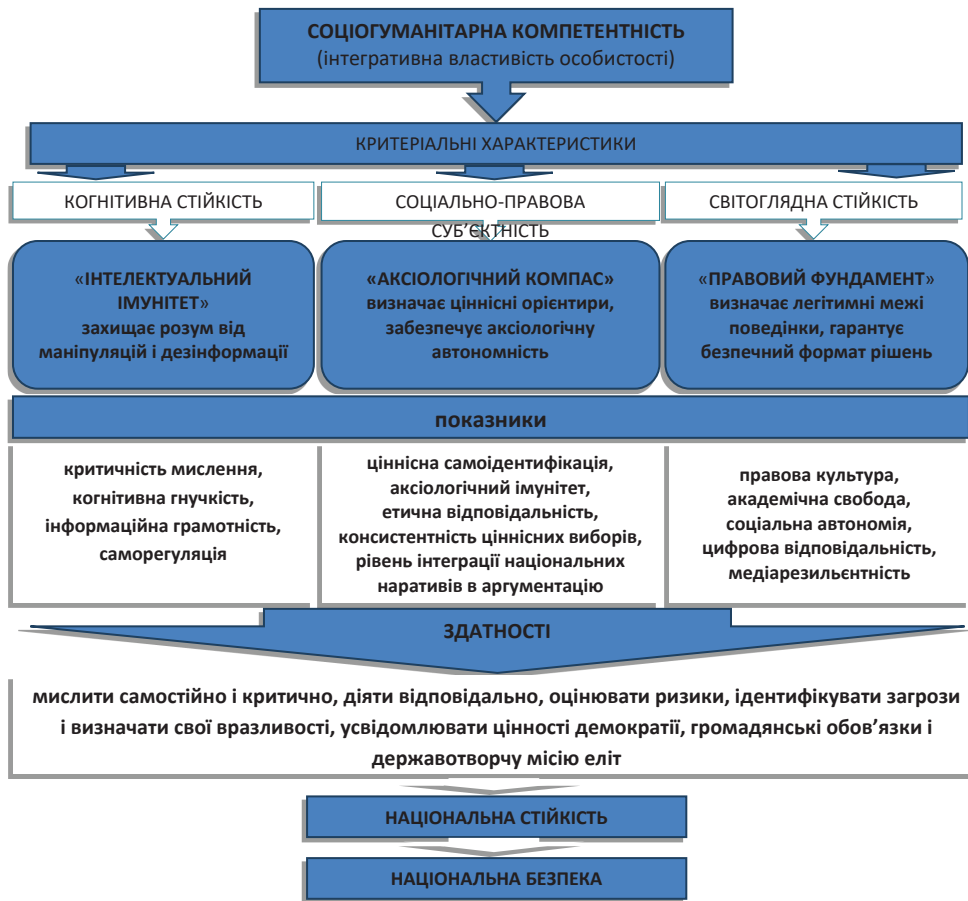
Рис. 2. Соціогуманітарна компетентність як фактор посилення національної стійкості і зміцнення національної безпеки

вигляді вони мають показати, чи навчив університет студента захищатися від маніпуляцій, чи просто дав йому набір фактів, які не працюють у критичній ситуації. Тобто моніторинг якості соціогуманітарної підготовки молоді має висвітлити показники ефективності закладу освіти щодо підготовки майбутніх фахівців не лише до професійної діяльності, але й до життя в умовах демократії. Це також перевірка спроможності закладу освіти готувати національну еліту країни.